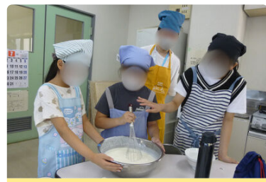
ランチクッキング