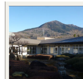
教育相談センター

電話で相談の日時を予約します。教育相談センターで「教育相談票」を記入し、相談員と面談します。