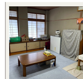
相談室(児童生徒用)

電話相談・対面による相談を開始後、お子様の様子を見ながら希望される方は入級を進めていきます。見学から体験を経て、正式入級となります。