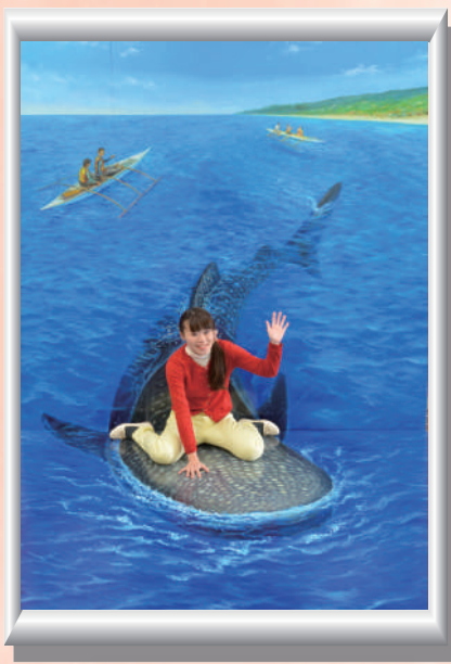
ジンベイザメの背に乗って