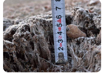
【場所】つくば市 【日時】12/24 7:05 【コメント】公園の霜柱。昨日の5cmより長い6cmでした。