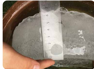
【場所】奈良県宇陀市 【日時】12/27 13:59 【コメント】6.5 cmの氷がはっています。

バケツに入れた水や水たまりの凍り方を観察するのもおすすめです。天気や気温と一緒に観察すると、新しい発見があるかもしれません。