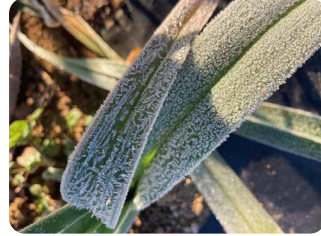
【場所】つくば市 【日時】12/26 7:51 【コメント】ニンニクの葉の霜。上の葉と下の葉で着ている霜の形が違う。上の葉の霜は長細いが、下の葉の霜は立方体みたいで、量も多い。なんで違うんだろう。

寒い朝は霜や霜柱を探してみましょう。お庭や公園で、自分だけの霜・霜柱スポットを見つけるのも楽しいですよ。