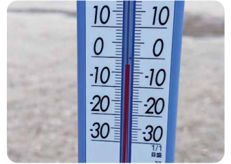
【場所】つくば市 【日時】12/25 7:01 【コメント】松代公園の広場、-2°C 今までで一番寒く感じた。