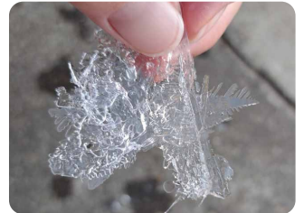
【場所】常総市 【日時】12/29 07:31 【コメント】バケツにはった氷 飛び出た所がもみの木みたい 何か面白い