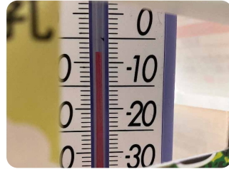
【場所】つくば市 【日時】12/25 6:56 【コメント】2階ベランダ 気温 -3.0°C やっぱり一階よりも1°C高い

寒さに負けず、毎日気温をはかってみましょう。任命式では気温のはかり方のコツやポイントをお伝えします。