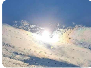
【場所】常総市 【日時】12/27 14:10 【コメント】彩雲 今日はたくさん彩雲が見れる。