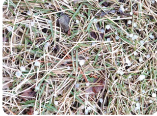
【場所】鳥取市 【日時】1/4 11:57 【コメント】数mmだったのであられだと思われそうです。