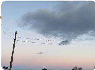
【場所】つくば市 【日時】1/4 16:45 【コメント】水色とピンクの綿飴みたいな可愛い空の色。東の空

冬は空気が澄んで、空の色が綺麗です。特に日の出や日の入りの頃はとても素敵なグラデーションが見られます。毎日の空色の変化にも注目してみましょう。