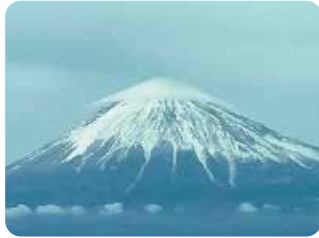
【場所】静岡県富士市 【日時】1/3 13:10 【コメント】北の空と富士山。笠雲(かさこじょうみたい)、冠雪が見れました。とてもきれいです。

冬の空にもいろいろな雲が登場します。山に現れる傘雲や虹色に色づく彩雲、○○みたいな雲。気になる雲はぜひふるリポ！で報告してください。