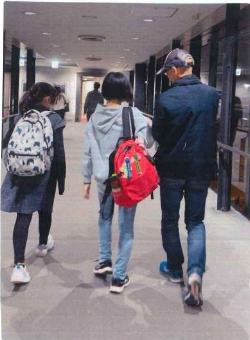
行きの飛行機に乗る時の写真