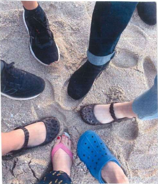
ビーチに行った時の写真