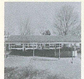
設置された当時の太陽光パネル(平成23年)