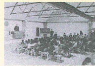
開校式の様子（昭和49年）