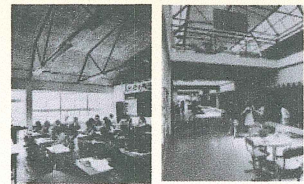
開校直後の教室(左)とワークスペース(右)