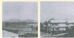
昭和48年2月の校舎建築以前(左)と昭和58年の小学校の様子(右)