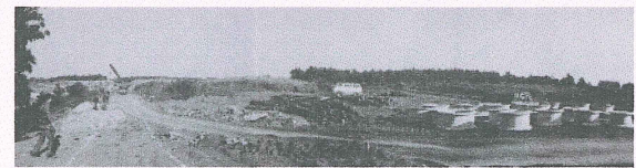
開校当時の工事の様子

高根沢教頭 授業時間を確保する必要からの切り替えである。また家庭訪問のかわりに、必要に応じ、教師が児童の住宅近辺を歩き、状況の把握をはかるようにしている。